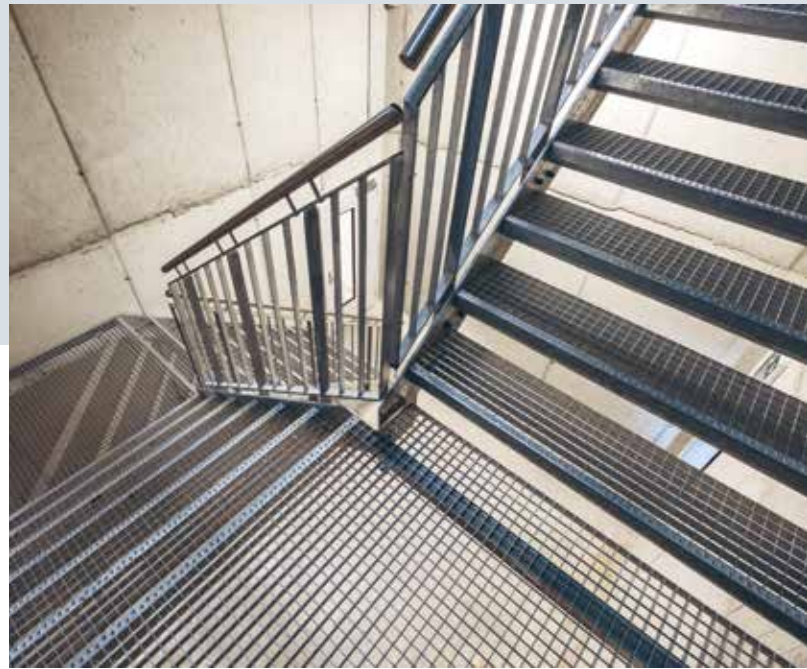
Die rutschhemmende Kante sorgt für einen sicheren Tritt. L'arête antidérapante renforce la sécurité.

mallichtmasse von 120 mm auch zwischen den Stufen nie überschritten.