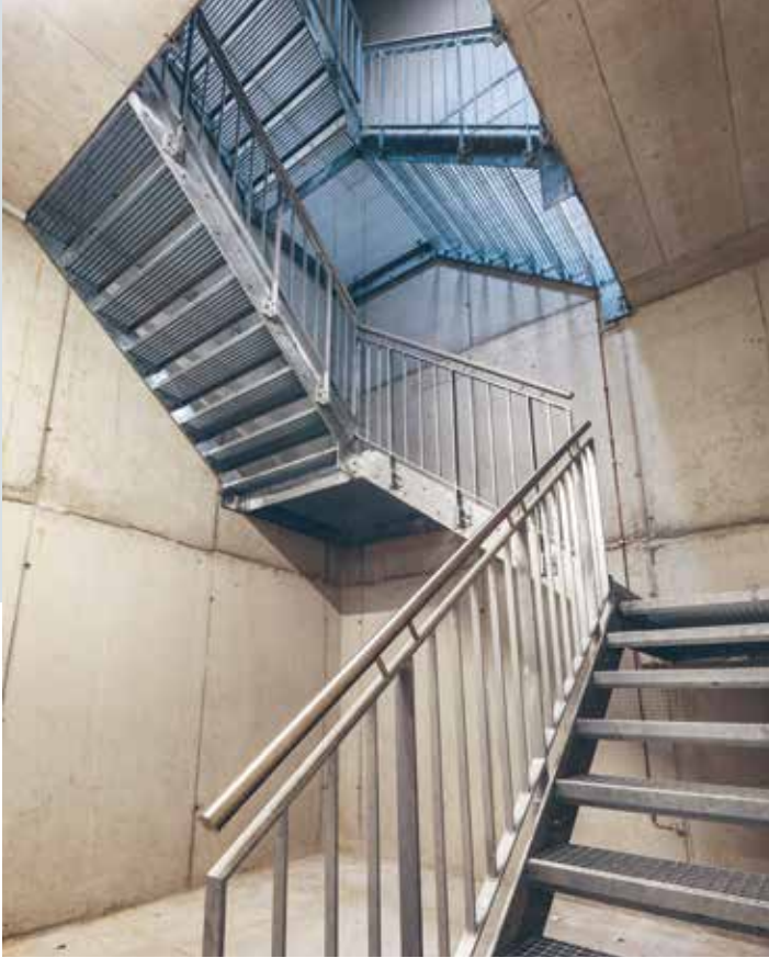
Die vertikale Kraftabtragung erfolgt auch über die Innenwangen. Le transfert vertical des forces se fait aussi via les limons intérieurs.